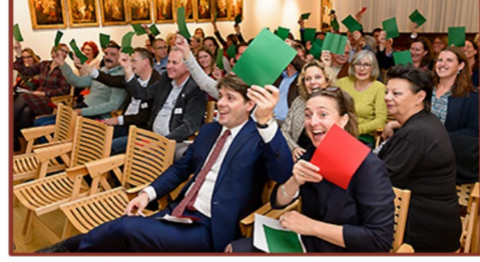
De zaal op de stoel van het expertpanel

Het expertpanel bespreekt wat er binnen het systeem nog kan (voorliggende voorzieningen), kijkt wat het Doorbraakfonds kan betekenen vanuit redelijkheid en billijkheid en benoemt een regisseur die de uitkomst terugkoppelt naar de aanvrager. Signalen worden neergelegd bij de beleidsafdeling van de gemeente. Bij de afweging binnen het panel draait het vaak